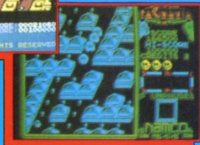
Amstrad screen shot