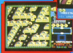
Spectrum screen shot