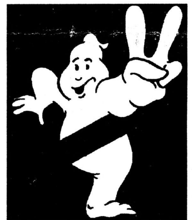
by John Difool and Pierrot le fou.