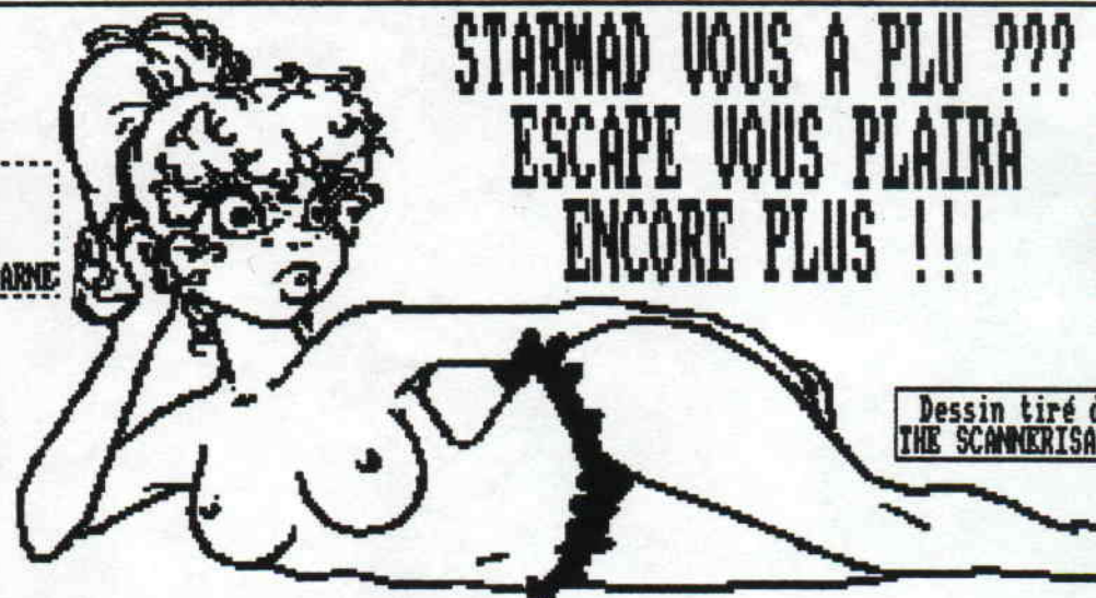
Dessin tiré de THE SCANNERISATOR