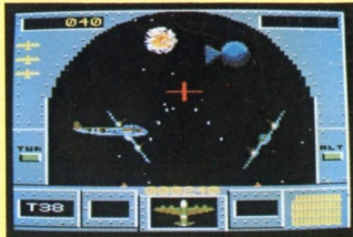
© COPYRIGHT 1986 DIGITAL INTEGRATION MADE IN ENGLAND