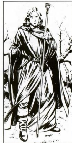
Por Larry Elmore, de "Dragons of Mystery"

Staff of the Magus (Bastón de Magus) (protection-protección +3; to hit-ataque +2 -damage-daño 1-8); Close combat with Staff as weapon (Combate a corta distancia con el Bastón como arma); Ranged combat (Combate a distancia) - ver lista de hechizos.