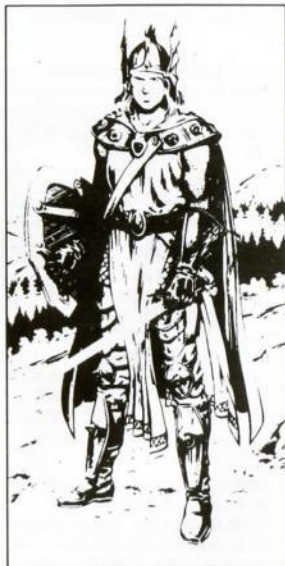
Por Larry Elmore, de "Dragons of Mystery"

Ring mail armor (Armadura de cota de maila); Longsword (Espada larga) (damage-daño 1-8); Spear (Lanza) (damage-daño 1-6).