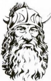
Por Larry Elmore, de "Dragons of Hope"

Flint, nacido y crecido en una pobre montaña de enanos, abandonó su hogar tan pronto como pudo ganarse el sustento. A medida que los años pasaban y sus habilidades mejoraron, su creciente fortuna le condujo a comprarse una pequeña casa en Solace, que se convirtió en su base.