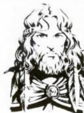
Por Larry Elmore, de "Dragons of Hope"

Huérfano por la muerte de su madre duende, Tanthalas, más conocido por la forma corta de su nombre humano como Tanis, creció entre los duendos. Sin embargo, como mitad humano siempre se sintió un poco rechazado. Finalmente, guiado por su incansable naturaleza, dejó Qualinesti y se dirigió a Solace, a visitar al único "forastero" que conocía, su amigo Flint. Con el tiempo, Tanis se vio envuelto con los Compañeros, Goldmoon y Riverwind, y se convirtió en un experto luchador, mitad duende mitad humano, errante por el mundo de Krynn en busca de la Curación Verdadera y de los clérigos.