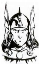
de "Dragon of Hope"

Caramon, el hermano gemelo de Raistlin, se puede considerar como completamente opuesto a su hermano. Desde los primeros años de su niñez, Caramon se convirtió en el protector de su hermano más débil, rescatándolo una y otra vez de increíbles tormentos. Su entrenamiento como guerrero cuando era un niño comenzó con su hermana Kitiara que más tarde se convertiría en el Dragón Highlord, al servicio de Takhisis.