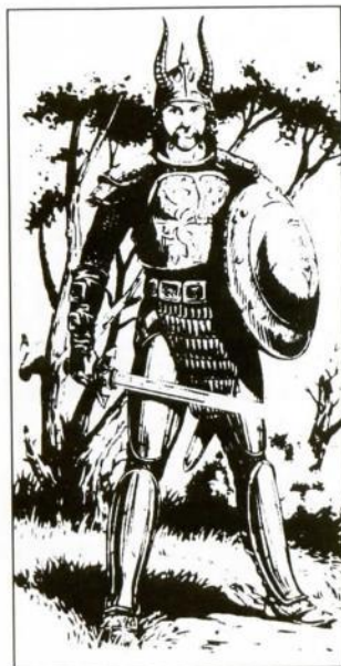
Por Larry Elmore, de "Dragons of Mystery"

Chainmail armor (Cota de maila); Two Handed sword (Espada de dos manos) +3 (damage-daño 1-10); No ranged weapon (Sin arma de alcance).