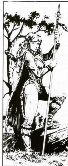
By Larry Elmore, from "Dragons of Mystery"

Leather armor (Armadura de cuero); Quarrestaff (Barra) +2; Medallion of Faith (Medallón de Fe); Clerical Magic (Magia Clerical), ver submenú.