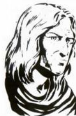
Por Larry Elmore, de "Dragons of Hope"

Era tan débil cuando nació que no pensaron que iba a vivir. Raistlin sobrevivió en su infancia gracias a los esfuerzos de su hermana y a la protección de su hermano gemelo, Caramon. Justo antes de su quinto cumpleaños, fueron a una feria donde un mago estaba realizando trucos de magia. Caramon observó durante un rato y luego se fue, pero su hermano estuvo allí todo el día y esa noche dejó alucinada a su familia reproduciendo cada truco que había visto realizar.