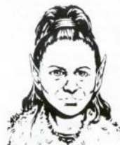
Por Larry Elmore, de "Dragons of Hope"

La mayoría de la gente no sólo no entiende a los Kender, sino que no quiere saber nada de ellos. Esto es debido, generalmente, a los rasgos básicos de su personalidad: audacia, increíble curiosidad, movilidad irresistible, independencia y necesidad de recoger cualquier cosa que no esté atornillada al suelo (a no ser que tenga un destornillador en cuyo caso...).