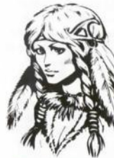
Por Larry Elmore, de "Dragons of Hope"

El futuro de Goldmoon, hija del jefe de la tribu Que-Shu, parecía que estaba planeado desde su nacimiento. Con quien quiera que se casara, se convertiría en jefe de la tribu. Pero los dioses tenían otros planes para ella, desconocidos por todo el mundo. El primer signo de estos planes apareció cuando Goldmoon se enamoró de Riverwind, en vez de cualquiera de los otros hombres jóvenes, más adecuados para ella.