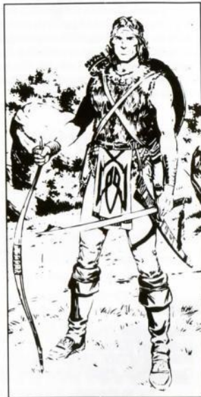
Por Larry Elmore, de "Dragons of Mystery"

Leather armor & shield (Armadura de cuero y Escudo); Longsword (Espada larga) +2 (damage-daño 1-8); Bow & quiver of 20 arrows (Arco y Carcaj para 20 flechas) (damage-daño 1-6).