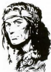
de "Dragons of Hope"

Nació en una familia de auténticos parias de la tribu, no existiendo nadie en Que-Shu con una posición social tan baja. Su familia se negó a creer en la divinidad del jefe de la tribu y fueron los últimos creyentes en los antiguos dioses. Riverwind, que fue tolerado por sus habilidades, hubiera vivido su vida solo si no fuera por su amor a Goldmoon, que le condujo a pedir el permiso de su padre para casarse con ella.