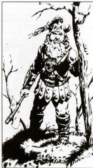
Por Larry Elmore, de "Dragons of Mystery"

Studded Leather armor & Shield (Armadura de cuero con metal y escudo); Battleaxe +1 (Hacha de batalla +1) (damage-daño 1-8); Throwing axes (Lanzamiento de hachas) (damage-daño 1-6).