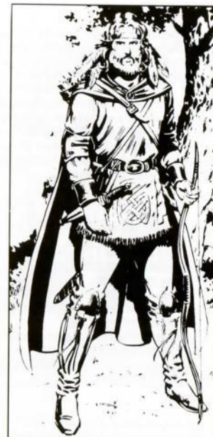
Por Larry Elmore, de "Dragons of Mystery"

Leather armor (Armadura de piel) +2; Longsword (Espada larga) +2 (damage-daño 1-8); Bow & quiver of 20 arrows (Arco y carcaj de 20 flechas) (damage-daño 1-6)