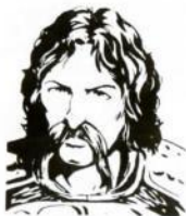
Por Larry Elmore, de "Dragons of Hope"

Sturm, hijo de uno de los verdaderos Caballeros de Solamnia, fue enviado al sur junto con su madre para que estuviera a salvo, cuando su padre no pudo garantizar por más tiempo la seguridad de su hogar. Su padre les mandaría buscar cuando las cosas se hubieran calmado, pero nunca lo hizo. En este momento los Caballeros no eran bien considerados por las gentes de Krynn, quienes les culpaban de fallar en su deber de detener el Cataclismo.