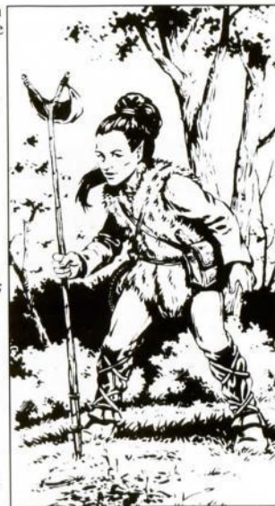
Por Larry Elmore, de "Dragons of Mystery"

Leather armor (Armadura de cuero); Hoopak +2 (damage-daño 3-8); Sling +1 with a pouch of 20 bullets (Honda +1 con una cartuchera de 20 balas) (damage-daño 2-7)