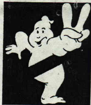
by John Difool and Pierrot le fou.