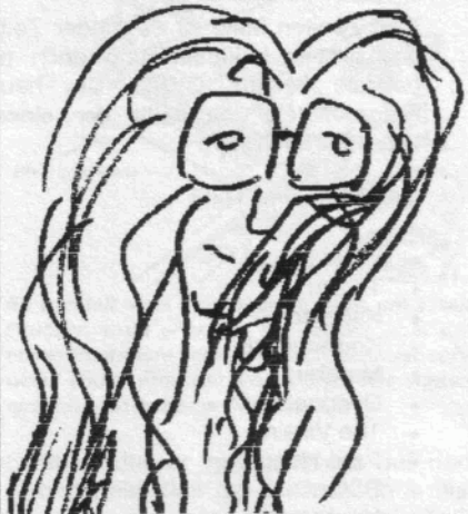
Odiesoft of HJT