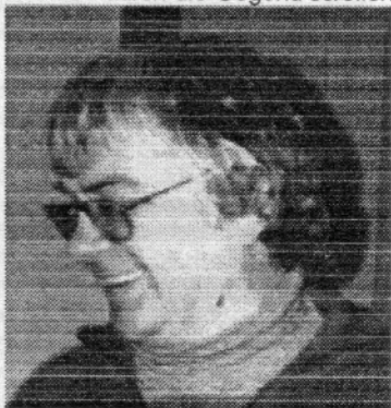
Überglicklich - der Entdecker des Peripheriescollings

Er hiepte seinen Drucker auf einen kleinen Teewagen und begann diesen durch die Gegend zu schieben. "Toll! Wieder eine neue Art des Peripheriescollings", dachte Marabu und versuchte Flugs darauf das Peripherieparallaxscrolling. Dazu startete er gleichzeitig zur Bewegung des Teewagens die Selbsttestroutine des Druckers und siehe da, es klappte. Ein dreidimensionaler Effekt, machte sich im Raum bemerkbar. Der Drucker scrollte seinen Druckkopf mit einer differierenden Geschwindigkeit als der Teewagen bewegt wurde. "Das ist Echtzeit Peripherieparallaxscrolling", jubelte Marabu, denn es wurde langsam echt Zeit an der Weiterentwicklung dieser neuen, wunderbaren, kaum zu fassender Technik zu arbeiten. Er überlegte kurz und kam zu dem Entschluß, daß er dieses Peripherieparallaxscrolling noch weiter austesten und entwickeln könne, wenn er seinen Teewagen und den Drucker in sein Auto befördere und dort wieder den Drucker einen Selbsttest ausführen lassen würde, wobei der Teewagen gleichzeitig bewegt werden müsse. Das Auto würde durch die Gegend scrollen,