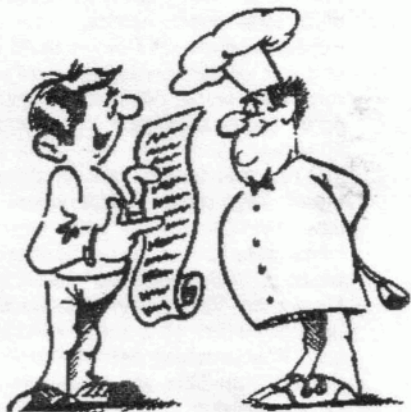
Der Chef hoffte auf großen Umsatz - vergeblich!

stellen: Da läuft so ne affenscharfe Demo von Alein, Proletron und Face Lifter und es ist absolute Totenstille! Auf'm Friedhof könnt's nicht schlimmer sein. Die andern beiden Demos kamen vom GWM und Bad Error. Das Demo vom Bad Error war, nun, ähhh, ... aber das vom GWM war wirklich voll cool, richtig Amigamässig eben! Die Democompo war vorbei und gewonnen hat das GWM Demo. Für mich jedenfalls. Als nächstes kam die Soundcompo, die mir schon bedeutend besser gefallen hat. Immerhin haben am Schluss ein paar Leute geklatscht.