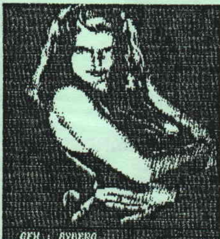
OFN : BYBERO

LA REDAC RECHERCHE LE MS-VOB - CPC RAYS, MEGA- PARTY DEMO 92, PRODATRON MEGADENO PARADISE DEMO. NEW AGE MEGA DEMO, SCRYPTÉ, DES DIGITS, DES SAMPLES, VOUS REALISA- TIONS, APIN QU'ON LES DIFFUSENT. CA FAIT UN PEU BEAUCOUP MAIS BON, QUI NE TENTE RIEN N'A RIEN N'EST-CE PAS ?