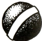
BOLA DE CRICKET